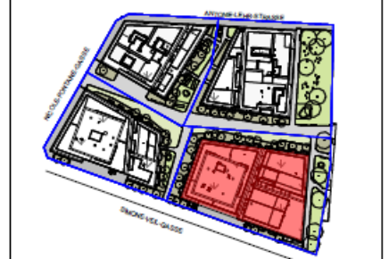
Übersicht Bauteil: D Untergeschoss